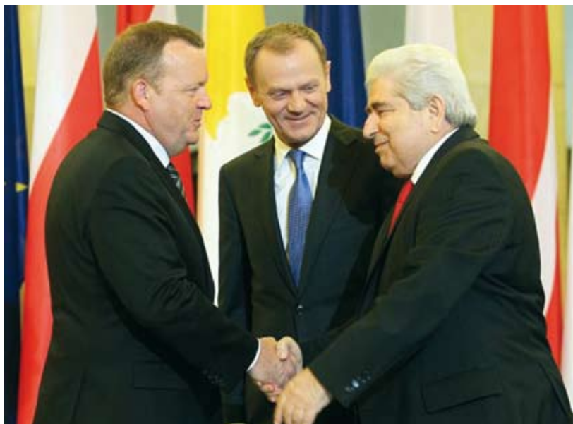
Prezydencja zbiorowa, tzw. trio (Dania, Polska, Cypr)