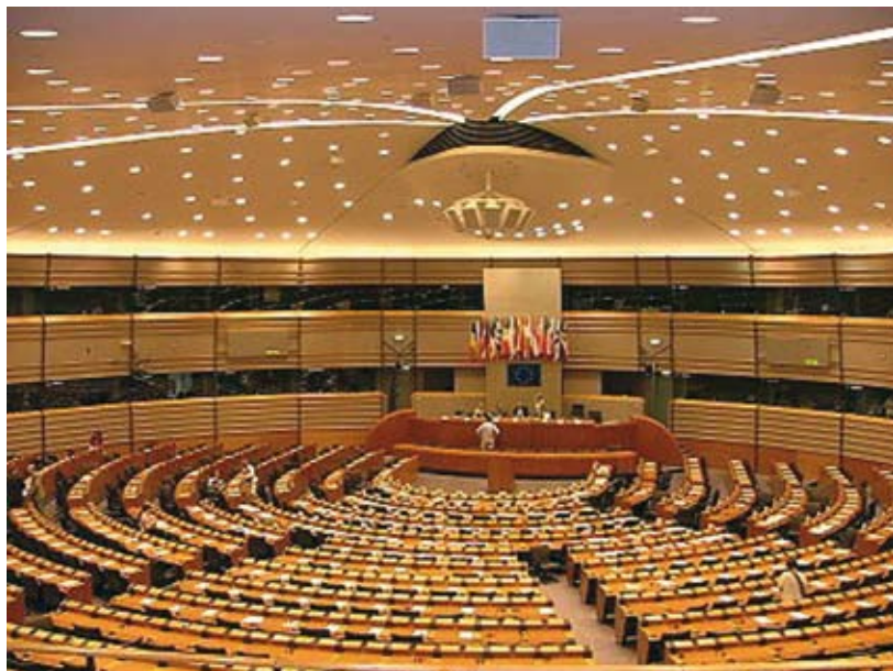
Sala obrad Parlamentu Europejskiego, Bruksela