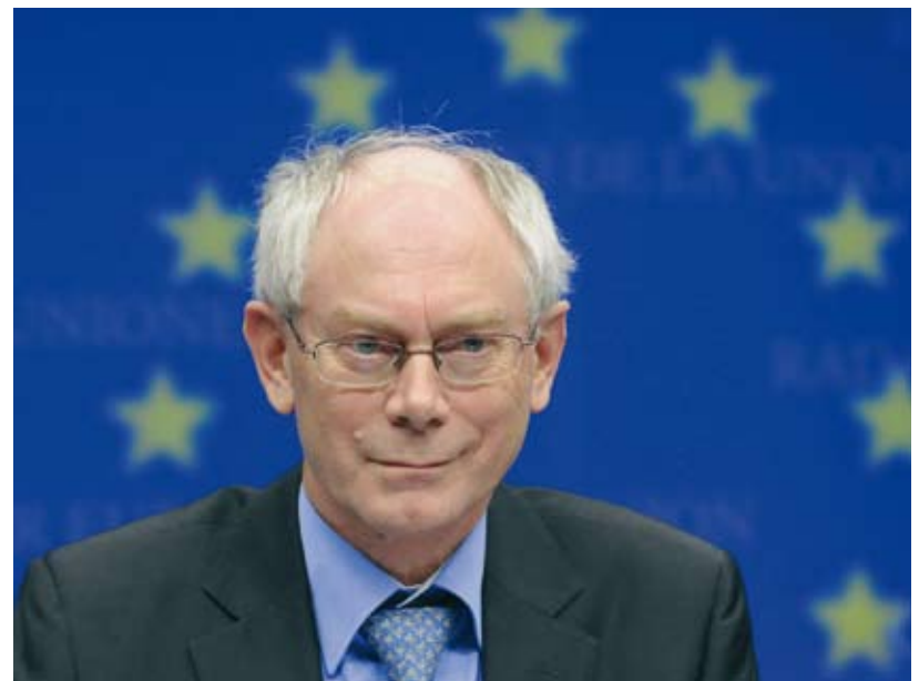
Herman Van Rompuy, pierwszy stały przewodniczący Rady Europejskiej