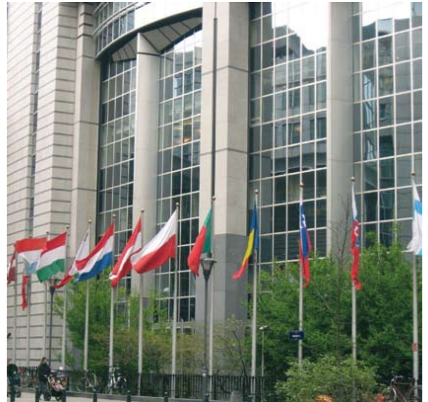
Parlament Europejski, Bruksela