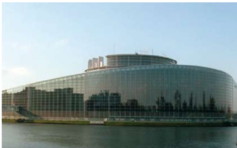
Parlament Europejski, Strasburg

Przemówienie w Parlamencie Europejskim w Strasburgu, 11 października 1988 r.